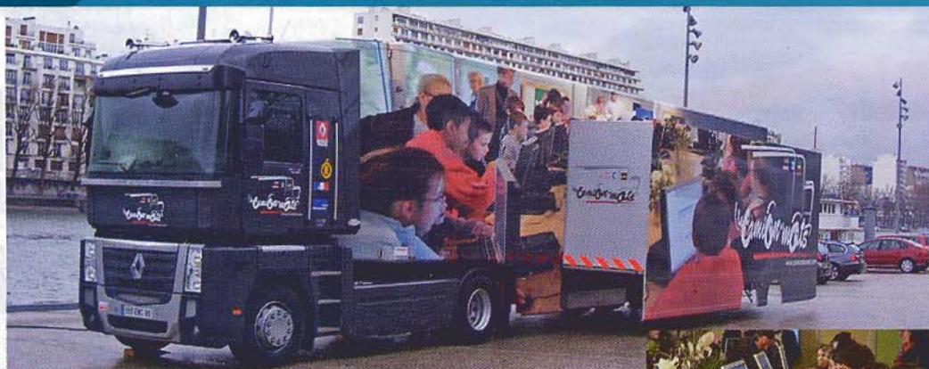
Le camion des mots est un bel exemple de véhicule événementiel complexe. L'équipement informatique en réseau doit être efficace et fiable.

... chance par ces temps de crises. La base est le plus souvent une semi-remorque et plus rarement un porteur qui deviennent régies vidéo pour des chaînes de télévision, podiums d'animation pour les armées, les conseils régionaux, quelques entreprises ou même des salles itinérantes de formation professionnelle ou d'animation. Cela peut être plus spectaculaire encore, comme ces salles mobiles de cinéma qui se déploient pour accueillir jusqu'à cent spectateurs. Chaque unité peut coûter de 100 000 € jusqu'à plus d'un million d'euros pour certains motor-homes réalisés pour des écuries de compétition. La nouvelle semi-remorque du camion des mots est un bon exemple de réalisation, destinée à une action itinérante initiée il y a trois ans par le magazine Lire. La