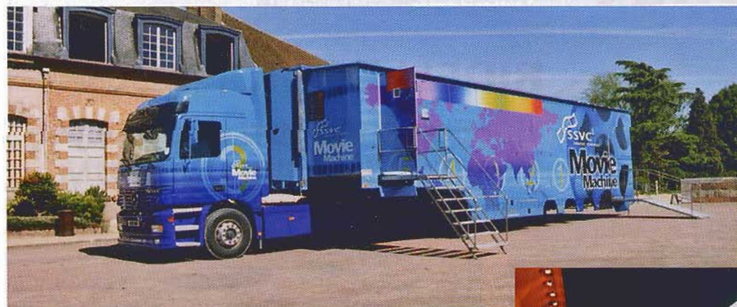
Une salle de cinéma de 100 places transportée dans une semi-remorque, oui, c'est possible !

En outre, des scies permettent de façonner des très gros blocs de mousses. De leur côté, les menuisiers préparent les meubles et cloisons. Du bureau d'étude jusqu'à la livraison au client, Toutankamion vit dans une parfaite autonomie. Le fil d'Ariane permet le suivi d'une fabrication d'un bout à l'autre s'appelle « la pige », imaginée dès 1967 par Marc Girerd. Ici, elle est ce que le patron est à la couturière : au cœur du système de qualité qui aide de très nombreux intervenants à se prémunir des inconvénients résultant des erreurs éventuelles de lecture, de transcription de l'opérateur ou du contrôleur. Cette méthode est représentée par un gabarit tridimensionnel à l'échelle 1 relié à la croix d'axe Autocad (le logiciel), sur lequel sont tracées les interfaces « inter-métiers », à l'aide d'une équerre informatisée. Pour mener