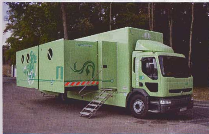
Les extensions permettent parfois de doubler la surface utile. Ici une réalisation Toutenkamion.

cuisine équipée, de couchages, d'un chauffage autonome et de la climatisation. Pour la sécurité, le pont électrique est débrayable en cas d'urgence, des caméras surveillent les chevaux et les marches arrière, complété par une alarme incendie et des extincteurs automatiques. Le tout pouvant être