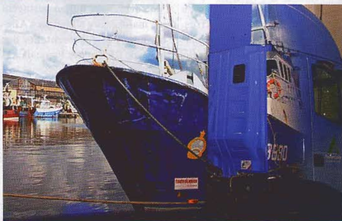
Les clients demandent des décors hyperréalistes. Ici Toutenkamion pour le conseil régional Nord-Pas de Calais.

220 000 à 340 000 € en fonction des versions sur porteur ou sur semi-remorque. Lorsque le nombre de chevaux à transporter doit être privilégié, il est possible d'en emmener 11, qui prennent place 8 têtes à droite et 3 têtes arrière. Les séparations entre les chevaux sont des demis bat-flancs avec tapis